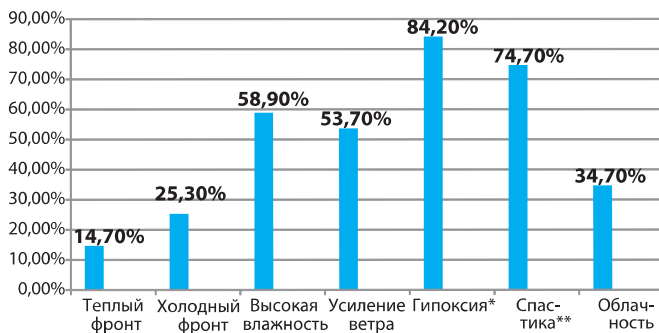
Рисунок 1. Частота развития метеопатических реакций у детей с БА при аномальных колебаниях погодных условий (%)