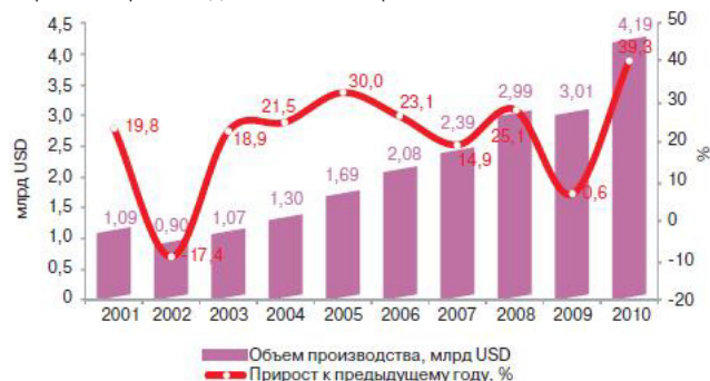
Рис. 1. Динамика отечественного фармацевтического производства в 2001–2010 гг.

Впервые положительные показатели динамики для всей отрасли в целом были получены в 1997 г. Оживление российской фармацевтической промышленности было обусловлено налаживанием выпуска готовых лекарственных средств. В XXI веке фармацевтическая промышленность России развивалась хотя и неравномерно, но динамично (см. рис. 1).