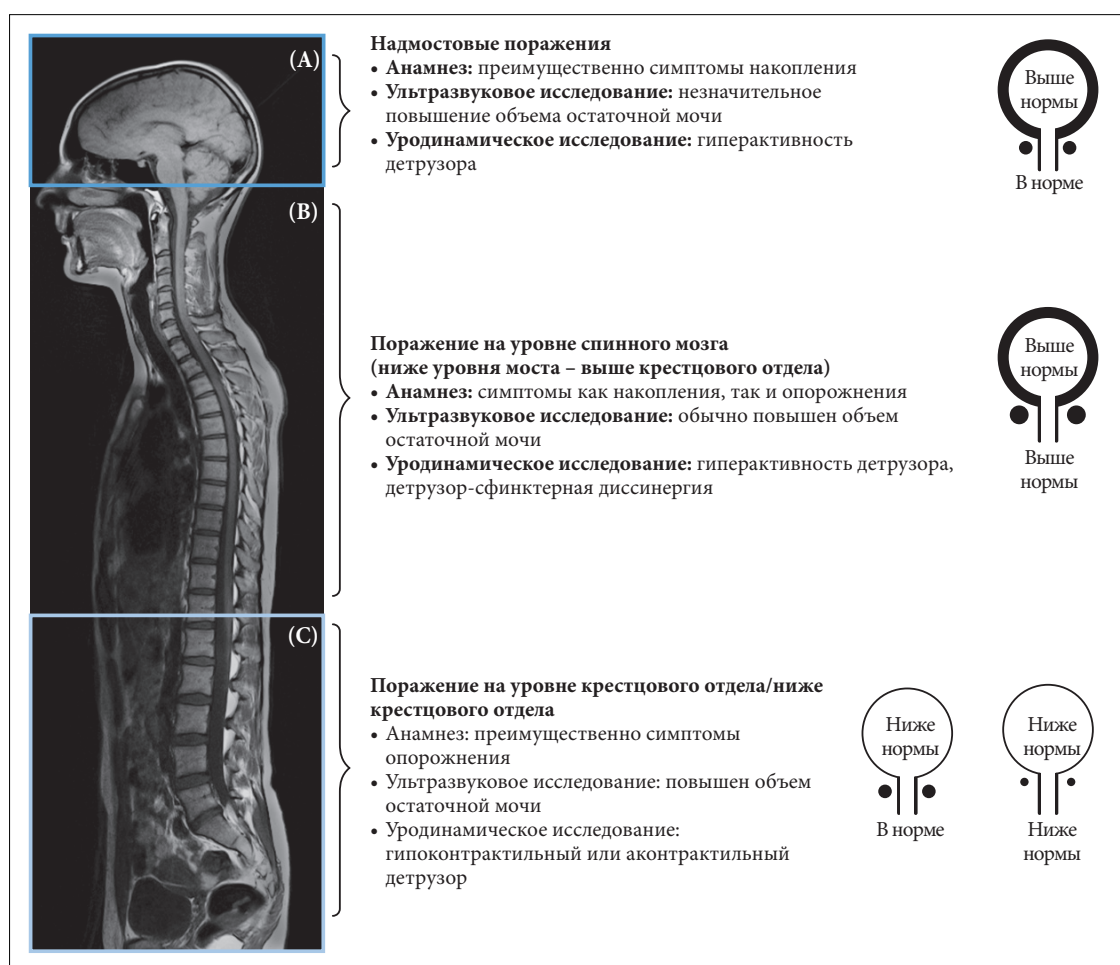
Рисунок 1/ Характер дисфункции нижних мочевых путей при неврологических заболеваниях [7]

Характер дисфункции нижних мочевых путей при неврологических заболеваниях определяется локализацией и характером патологии. На рис. 1 представлена очень простая классификация для клинической практики, которая позволяет определить необходимую тактику лечения [7].