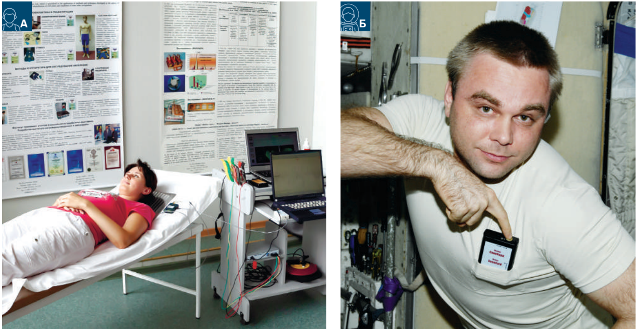
Рис. 2. а) программно-аппаратный комплекс «Кардиосон», б) его бортовой прототип «Сонокард» у летчика-космонавта М.В. Сураева

К методам профилактики относится, например, широко известная электромиостимуляция, активно используемая космонавтами на станциях «Мир» и МКС. Этот метод обладает неограниченным потенциалом применения в клинике. В настоящий момент ИМБП совместно с Бернским университетом (Швейцария) разработал методику использования низкочастотной электромиостимуляции для помощи пациентам с хронической сердечной недостаточностью (с развившейся миопатией). В дальнейшем планируется применять методику и для других категорий пациентов [14].