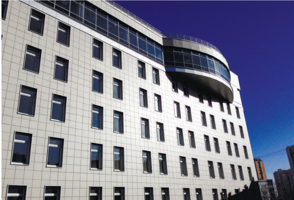
Рис. 7. Международный центр изучения медико-биологических аспектов межпланетных перелетов и внеземных поселений

ных групп (технология «Навигатор здоровья»), а также углубленного обследования и тестирования с целью реализации программ поддержания и целенаправленного развития физического здоровья различных групп населения: школьников, лиц призывного возраста, широкого контингента населения. Кроме того, будет обеспечена возможность тренировки лиц экстремальных профессий, проведения физической реабилитации после различных клинических ситуаций [13].