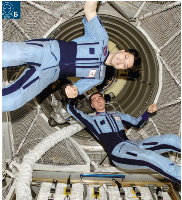
Рис. 5. а) Использование костюма аксиального нагружения в терапии двигательных нарушений, б) его бортовой прототип на летчиках-космонавтах С.А. Волкове и О.Д. Кононенко

тов на стадии отбора, в период предполетной подготовки, во время полетов, после возвращения на Землю и в условиях модельных наземных экспериментов накоплен большой объем уникальных данных о функциональных показателях и реакция здорового человека в покое, при функциональных нагрузках и в экстремальных ситуациях. Многостороннее систематическое изучение всех жизненных процессов, протекающих в здоровом организме человека, обогатили медицину знаниями о нормальных реакциях на различные воздействия окружающей среды. Проведенные исследования позволили подойти к научному решению вопроса о норме функциональных показателей организма и его реакций на определенные воздействия, который в традиционной медицине изучен недостаточно, поскольку последняя имеет объектом своего внимания преимущественно больных людей.