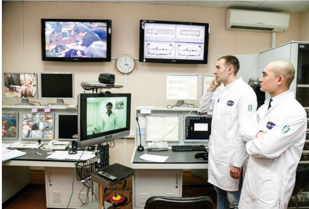
Рис. 4. Тестирование телемедицинских технологий в ходе эксперимента SIRIUS-1